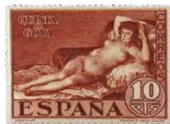
▶ 5 - La Maja nue , Francisco Goya

Parmi les oeuvres picturales exceptionnelles on doit citer le subtil érotisme du tableau Diane au bain d'Antoine Watteau, La lettre d'après Jean-Honoré Fragonard ou Le Retour de Diane par François Boucher.