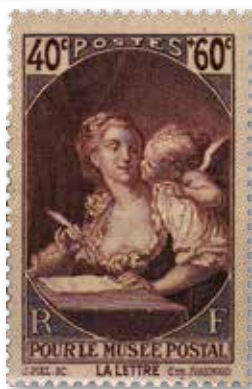
▲ 3 - La lettre , Jean-Honoré Fragonard