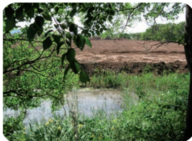
Remblaiement d'un marais

Conjointement, l'intensification de l'agriculture à partir des années 60 a entraîné une nette diminution des surfaces en herbe au profit de la céréaliculture. L'abandon de l'élevage traditionnel a conduit à un désintérêt des agriculteurs pour les surfaces en