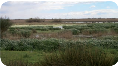
Réserve naturelle de Camargue

L'hivernation se déroule généralement dans la végétation dense (saulaie, cariçaie, roselière) présentant une bonne épaisseur de vase dans laquelle les animaux peuvent s'enfouir pour bénéficier de conditions thermiques stables.