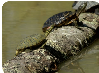
Tortues de Floride