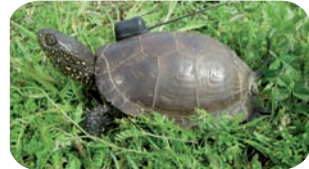
Tortue équipée d'un émetteur, RNN Chérine (Indre)