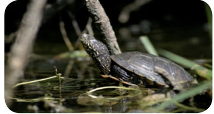
Cistude, Isère

La Cistude d'Europe est une tortue de petite taille (20 cm au plus pour généralement moins de 1kg), présentant une carapace lisse et légèrement aplatie de couleur sombre, marquée de ponctuations ou de lignes jaunes tout comme les pattes, la tête et la queue. Les pattes sont palmées et pourvues de fortes griffes.