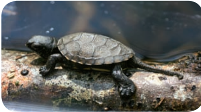
Jeune Cistude, Isère