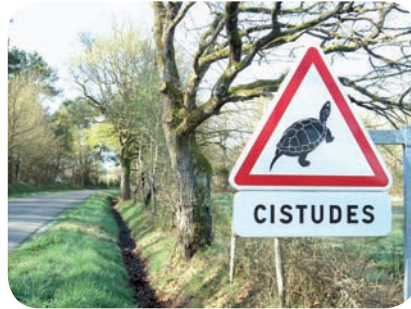
Signalétique cistude