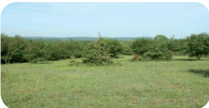
Site de ponte, Réserve naturelle de Mèpieu (Isère)

cié à une végétation peu développée facilite le creusement du nid et l'incubation des œufs par le soleil. Le comportement de ponte peut occasionner des déplacements en milieu terrestre de quelques mètres à plusieurs kilomètres.