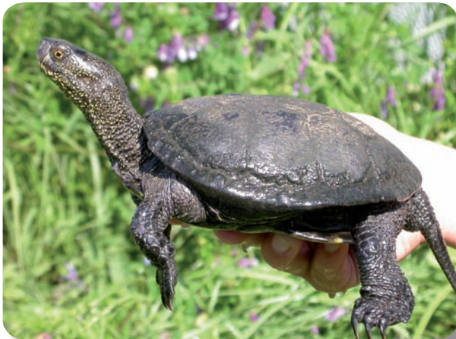
Cistude d'Europe, Portuglio (Corse)