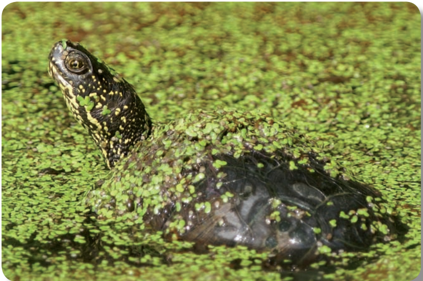
Cistude d'Europe, Gers