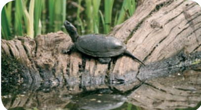
Cistude d'Europe, Réserve naturelle de Chérine (Indre)