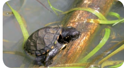
Jeune cistude

Réserves naturelles, A.P.P.B., Natura 2000, ... permettent de pérenniser des habitats et parfois une gestion favorable à l'espèce. Dans certains cas, la maîtrise foncière garantit la conservation à long terme des populations