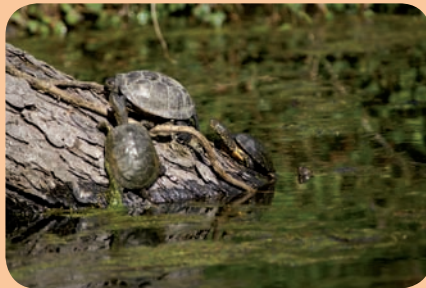
Individus en insolation, Gers

Bureaux d'études et porteurs de projets doivent être informés en amont de la présence de la cistude afin d'adapter les projets.