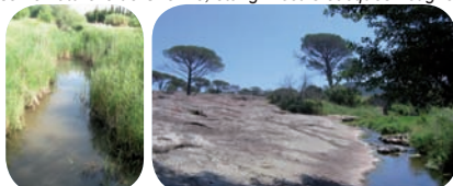
Milieux abritant la Cistude d'Europe, (Var, Maures)