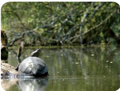
Cistude d'Europe, Aquitaine

Les acteurs du plan : Ministère de l'Ecologie, du Développement Durable, des Transports et du logement, 11 DREAL, Conservatoire du Patrimoine Naturel de Savoie, Société Herpétologique de France, établissements publics (MNHN, ONEMA, ONCFS, ONF, Agences de l'eau, Réserves naturelles, Conservatoire du Littoral, Universités, etc.), associations de protection de la nature, Fédérations de Pêche, socio-professionnels (pisciculteurs, agriculteurs). Ces acteurs sont représentés dans un comité de pilotage réuni annuellement.