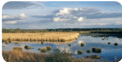
Réserve naturelle de Chérine, étang Ricot