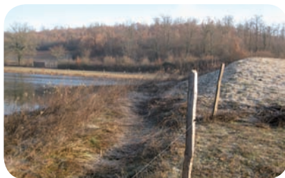
Dune de ponte artificielle, étang de Lemps

L'ensemble des interventions sur les milieux est effectué selon un calendrier basé sur les exigences biologiques de l'espèce (mises en évidence au travers d'études spécifiques). Les travaux de réouverture de milieux secs, de curage de canaux et de fossés, de broyage de saulaies ou de roselières, peuvent être mis en œuvre afin de conserver le milieu tout en limitant fortement les risques pour l'espèce.