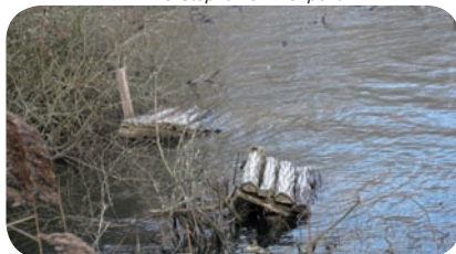
Solariums artificiels, étang de Lemps