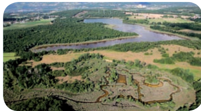
Réserve naturelle de Mèpieu (Isère)

La ponte est déposée le soir ou la nuit à peu de distance du milieu aquatique, sur des terrains secs et bien drainés. Les pelouses sèches et les prairies constituent des habitats particulièrement favorables. Les femelles recherchent des sites où un substrat fin asso-