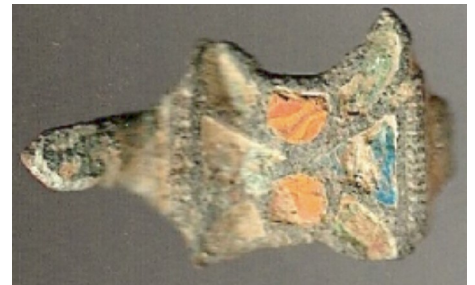
Fibule 'trouée' souvent par paire reliée par une chaînette.