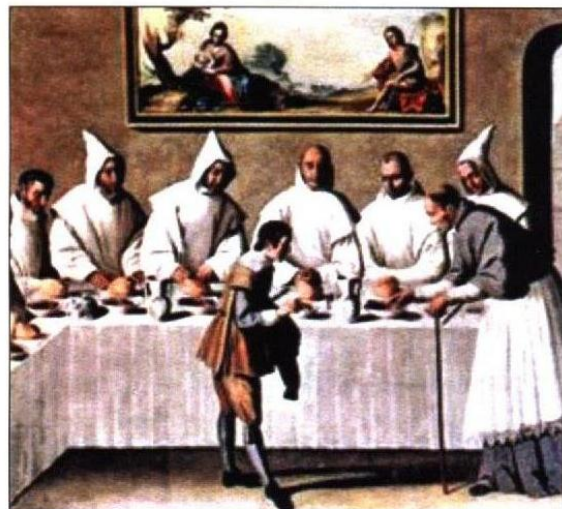
Ci-dessous, Saint Hugues au réfectoire des Chartreux, par Francisco de Zurbaran

chroniques, Saint Hugues arrive à l'improviste au monastère, et trouve les sept moines à table, contrits parce qu'on leur servait comme nourriture des oiseaux rôtis un vendredi. Saint Hugues bénit les plats, mais transforme les oiseaux en tortues, considérées à l'époque comme "ni chair ni poisson" selon le Saint Canon. Les tortues sont donc devenues les emblèmes du monastère, et elles sont représentées sur les documents et objets de la Grande Chartreuse. Toutefois, un mystère demeure, car à l'époque on consommait régulièrement des tortues d'eau, des Cistudes, le vendredi, car c'était une chair maigre (avec des grenouilles ou des escargots). Mais les tortues représentées sur le pin's sont nettement terrestres, ce qui est assez surprenant. (Manuel Riera)