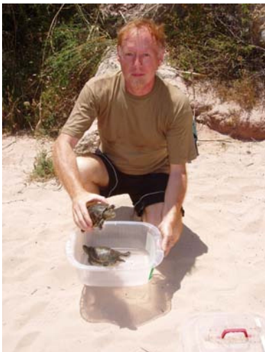
Minorque 2005 - Relâcher de cistudes ayant passé un an à Barcelone

often important in their area, where emys are still living to protect and reinforce endangered populations. Friendly organizations like SOPTOM or CARAPAX are supporting our initiative.