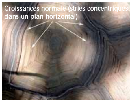
Photo 3 : Croissance normale des écailles de kératine chez une tortue sillonnée ( Geochelone sulcata ).