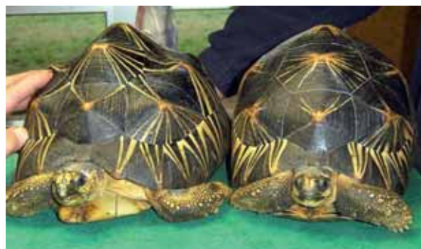
Photo 1 : Astrochelys radiata . Noter la présence d'excroissances pyramidales sur la dossière de la tortue de gauche.

Cependant, en dépit de tous les progrès accomplis en terrariophilie depuis ces trente dernières années en matière de nutrition (en veillant par exemple à fournir aux juvéniles des végétaux particulièrement riches en calcium et en fibres), d'éclairage (avec l'avènement des tubes et spots UVB disponibles en points de vente spécialisés) et de conditions de maintenance (de mieux en mieux adaptées aux besoins spécifiques requis par chaque espèce), de nombreux éleveurs ont encore aujourd'hui à déplorer cette pathologie en captivité. Même si tous ces paramètres ont probablement un certain rôle à jouer dans l'apparition de ces déformations, il est apparu de plus en plus probable qu'un autre facteur en soit responsable. L'amélioration de la qualité nutritionnelle de l'alimentation proposée ainsi que l'optimisation des conditions environnementales ont, certes, permis d'augmenter l'espérance de vie de bon