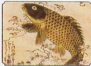
Swimming Carp, 1849 Hiroshige 1797-1858