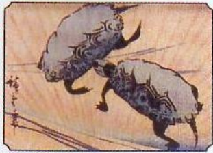
Two Terrapins (Eran print) Hiroshige 1797-1858