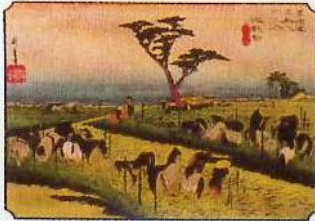
Chiyu: The Summer Horse Fair, 1834-1835 Hiroshige 1797-1858