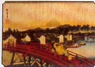
Shower over the Nihonbashi, 1831 Hiroshige 1797-1858