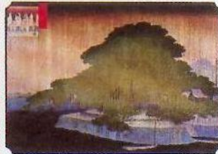
Night Rain at Karasaki, 1834 Hiroshige 1797-1858