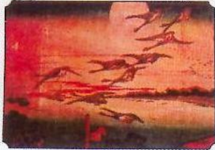
Takenawa by Moonlight, 1839 Hiroshige 1797-1858