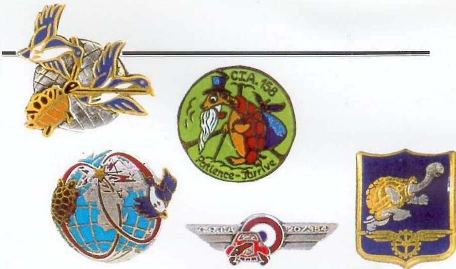
Avion du GMMTA avec le logo de la tortue sur le moteur / Insignes (de gauche à droite) du GMMTA, du Centre d'Opérations, du CTA 58, du CRTA, du ERTA.

d'Opérations, qui utilise les mêmes éléments que ceux du COGMMTA, COCOTAM ou COCFAP, mais en les organisant d'une manière différente; la tortue, le canard, le globe, se laissent donc expliquer par la même symbolique (ci-dessus à gauche). Globe terrestre aux continents d'argent et aux mers d'azur. Le globe est chargé d'une étoile à dextre et senestrée d'éclairs de gueules, d'une tortue en blanc dextre marron clair et marron foncé, d'un canard en blanc senestré d'azur foncé et d'émail blanc, et de deux trajectoires de gueules. Homologué N°A984.