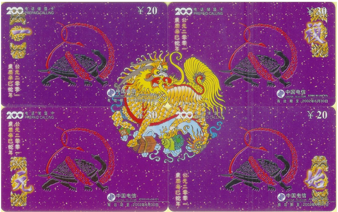
Télécartes chinoises pour le puzzle de quatre ci dessus, japonaises pour les trois autres.