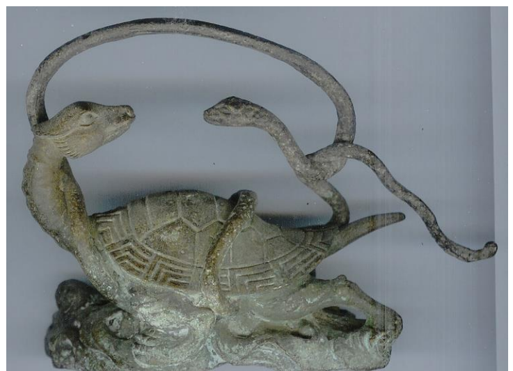
Statuette en bronze – 5eme siècle